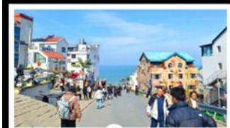
ถนนคอปเพิลิงหมายเลข 8

สัมผัสความยิ่งใหญ่ของ 4 เมืองสำคัญ ชิงเต่า - เยียนโก - เฟิงไห่ - เว่ยไห่ ปาต้ากวน - โบสถ์คาทอลิก - ตึกเก่าริมหา