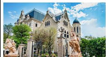
NINA CHOCOLATE CASTLE

ทะเลสาบสุริยจันทรภาพ - ไทเป 101 จิวเฟิน - NINA CHOCOLATE CASTLE MONSTER VILLAGE - ซีเหมินติง เมนูพิเศษ ปลาประจานาธิบดี ชื่อยวหลงเปา / ชาบูใต้หวัน