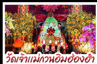
วัดเจ้าแม่กวนอิมฮองฮำ

วิวตอเรือพิศ - วิวหวังต้าเซียน - พระใหญ่ปิวหลิม กระเช้าเองปิง - วิวเซกวงหมิว - รางรางพืดแถม วิวเจ้าแม่กวนอิมฮองฮำ - วิวหมิ่นไห่บ่วง - เจ้าแม่กวนอิมรีพลัสเบย์ ปักไต่ฮองฮำ - ซ้อปึงจู่ใจ..ตลาดเลดี้ มงกิก และซีตีทก เจาท์เกต เมบูสุดพิศษ ห่านฮ่าง ตีมฮำฮองกง บูฟฟต์ซาบูสไต้ลฮองกง