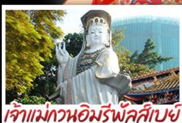
เจ้าแม่กวนอิมรีพลัสเบย์