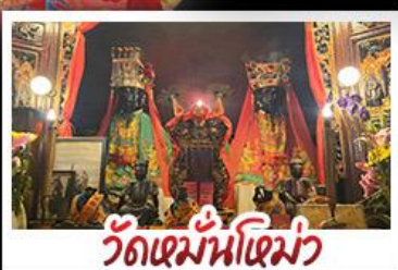
วัดเซมันไห่เม่ว