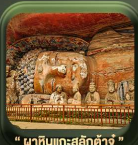
“ ผาหินแกะสลักต้าจู้ ”