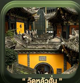
“ วัดหลิวอัน ”