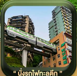
“ นิ่งรตไฟทะลุตึก ”

บินตรงลงวงซิ่ง • อุ้หลง หลุมฟ้าสะพานสวรรค์ • ละเบียงแก๊ว • อุทยานเขานางฟ้า หงหยาดัง • นิ่งรตไฟทะลุตึก • ศาลาประชาคม (ด้านนอก) • หลงหมินฮ่าว มรดกโลกผาหินแกะสลักต้าจู้ • วัดหลิวอัน • ตึกตะเกียบ • ถนนคนเดินเจียฟ้างเปี่ย