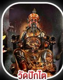
วัดบิกไค