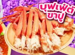
บุฟเฟ่ต์ ซาซึ