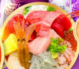
ตลาดปลาฮิมสุ คาชิโนะอิชิ