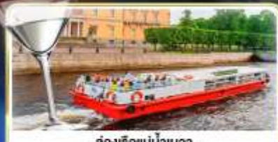
ล่องเรือแม่น้ำเนวา พร้อมเสิร์ฟ Vodka Tasting

เส้นทาง : 14-21 มิ.ย.69 / 28 มิ.ย.-05 ก.ค.69 / 24-31 ก.ค.69