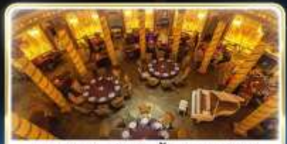
ทานอาหารสุดหรู ร้านTurandot