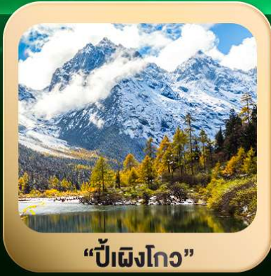
“ปี่ฝิงโกว”

ชมธรรมชาติ 2 อุทยานขึ้นชื่อ อุทยานภูเขาสีดรุณี + อุทยานปี่ฝิงโกว สะพานหนานเฉียว • ถนนคนเดินไท่กุ่หลี่ + ซุนซีลู่ + Pop Mart • ตงเจียวจื่อ