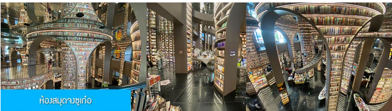
ห้องสมุดจวงชู่เก๋อ

พักที่ โรงแรม MINGZHISHANGCHUN HOTEL ระดับ 4 ดาวท้องถิ่นหรือเทียบเท่าในเมืองจูเจียงเย็น