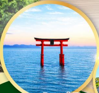
ทะเลสาบบิวะ - ศาลโทริอิ