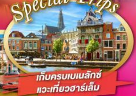
เก็บครบเบเนลักซ์ แะเที่ยวฮาร์เล็ม