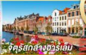
จัตุรัสสากส์ฮาร์เล็ม