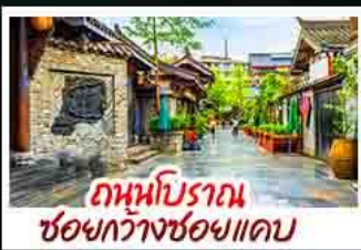
ถ่านบิราถนช่อกวางช่อกแคบ