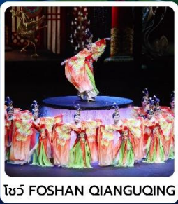
โชว์ FOSHAN QIANGUING