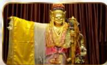
เทพทันใจจีเข้า