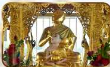
ขอพระพระอุปัค ปางจกบาตริเยียมาร