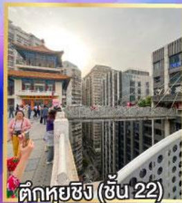
ตึกหุ่ยซิง (ชั้น 22)