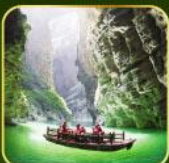
ล่องเรือแม่น้ำไตคินกูฮิว