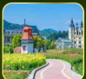
สวน Alice's Garden