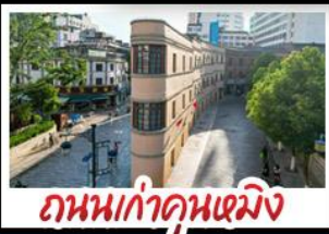
ถนนเก่าคุณหมิง

ภูเขาหิมะมังกรหยก+กระเช้าใหญ่ วัดลามะซงจันหลิน - ถนนเก่าคุณหมิง รถไฟชมวิวกุหาหิมะมังกรหยก หุบเขาพระจันทร์สีน้ำเงิน - ช่องแคบเสือกะโจน เมฆพิเศษ ขนมหิมะสามเสพาน สุกั๊บล่าแซมมอน อาหารกวางตุ้ง