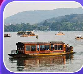
“ล่องเรือทะเลสาบซีหู”