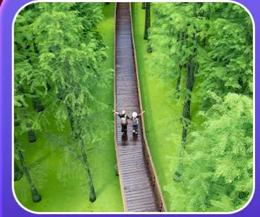
“ป่าสนชิงซาน”

T2G-HGH01GJ Welcome Hangzhou...หังโจว ฉู่โจว ฉู่หยวน ช่างเหรา หุบเขาเทวดา 5D 4N (GJ)