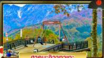
ฮาคุบะ:ชิงากาตะ