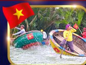
ล่องเรือกระดิว หมู่บ้านกัมกาน