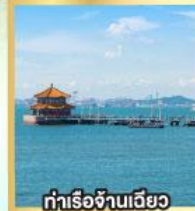
กำเรือจันทันเฉียว