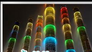
น้ำพุไม้ไผ่ตักSKP