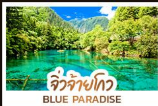
จิวจ้ายโกว BLUE PARADISE