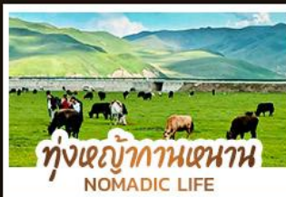
ทุ่งหญ้ากานหนาน NOMADIC LIFE