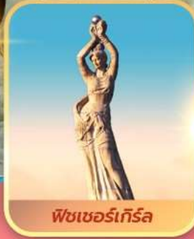
พีชเซอร์เกิร์ล