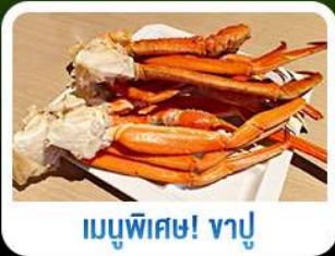
เมนูพิเศษ! ซาซิมิ