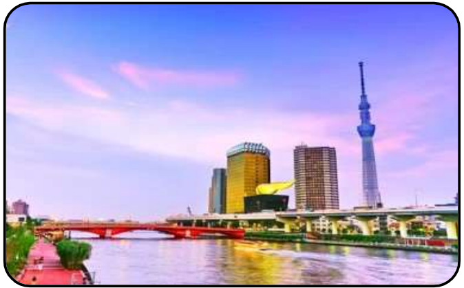
แม่น้ำซูมิดะ

สักการะ วัดมัตสึจิยามะโชเด็น หรือ “วัดหัวไชเท้า” ซึ่งเป็นวัดเก่าแก่ในย่านอาซากุสะ เป็นวัดเก่าแก่ในย่านอาซากุสะ กรุงโตเกียว ตั้งอยู่บนเนินเขาเล็ก ๆ ริมแม่น้ำซูมิดะ จุดเด่นคือเป็นวัดที่ขึ้นชื่อเรื่อง “ขอพรด้านการเงิน” โชคลาภ และความสำเร็จในธุรกิจ ส่วนไฮไลต์สำคัญของวัดนี้คือ ไคคอน หรือหัวไชเท้า สัญลักษณ์ศักดิ์สิทธิ์ คนที่นี้เชื่อว่าไคคอนช่วย “ชำระล้างสิ่งไม่ดี” และนำโชคลาภเข้ามา นักท่องเที่ยวมักนำไคคอนไปถวายเพื่อขอพร