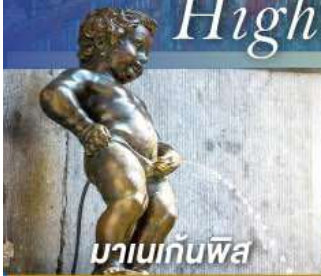
มานเนกันพิส