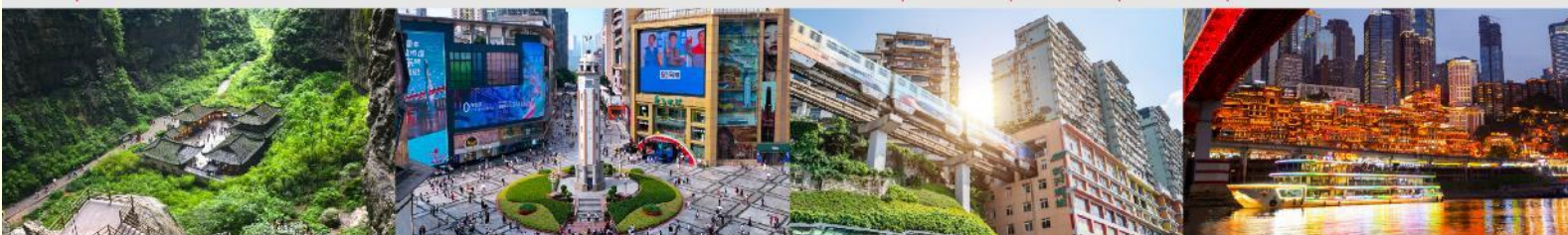
อุทยานแห่งชาติหลุมฟ้า 3 สะพานสวรรค์ ถนนเจี๋ยฟางเป่ย์ รถไฟทะลุตึก หงหยาดัง