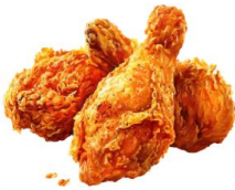
● ไม่ทานสัตว์ปีก (ไก่)