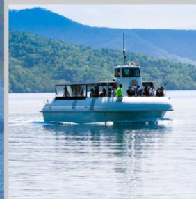
“LAKE SHIKOTSU GLASS BOAT”