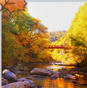
“JOZANKEI FUTAMI BRIDGE”