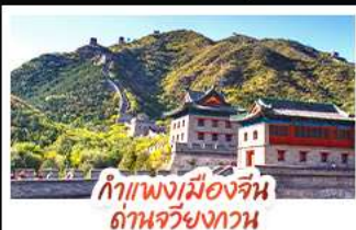
กำแพงเมืองจีน ด่านจวิ้นกวน