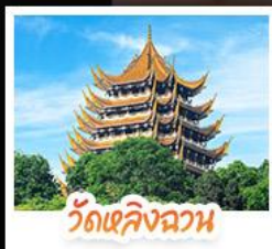
วัดเลิ่งฉวน