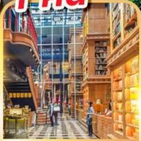
ร้านไอศกรีมมियाฮาร่า