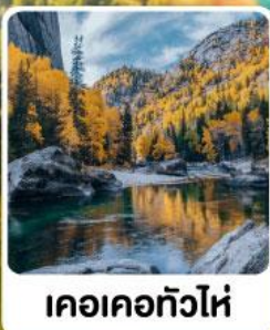
เคอเคอทัวไห่