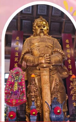
วัดเซกวง ขอพรโชคลาภ การเงิน และธุรกิจ