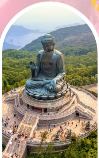
นั่งกระเช้ามองปีง นมัสการพระใหญ่ไป๋หวลิน