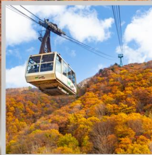
“ZAO CHUO ROPEWAY”