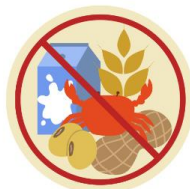
● แพ้อาหาร / อื่นๆโปรดระบุ