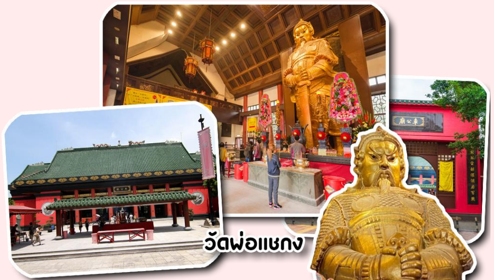
วัดพ่อแชกง