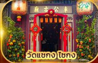
วัดแขก ไชกง