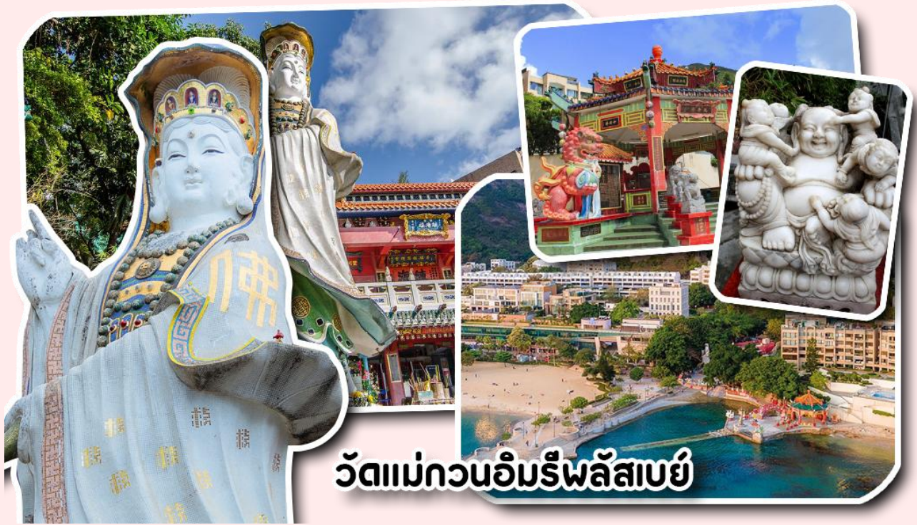
วัดแม่กวนอิมรีพลูเอ๋

อยากได้ลูกสาวให้ลู่บ่ท้องขวา ถัดมาคือ เจ้าแม่ทับทิมเทพีแห่งท้องทะเล ท่านจะคอยคุ้มครองผู้เดินทางทางเรือ หรือผู้ที่เดินทางไปไหนมาไหนท่านจะคอยคุ้มครองให้ปลอดภัย และมีโชคลาภ ถัดจากบริเวณที่กราบไหว้ขอพร ก็จะมีศาลาแปดเหลี่ยมริมน้ำ และสะพานเล็กๆ ที่ชื่อว่าสะพานต่ออายุ ซึ่งเชื่อกันว่าหากเดินข้ามสะพานแห่งนี้ 1 ครั้ง ก็จะมีอายุยืนขึ้น 3 ปี