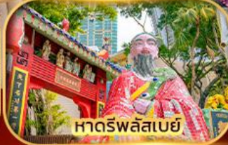
หาดรพลัสเบย์