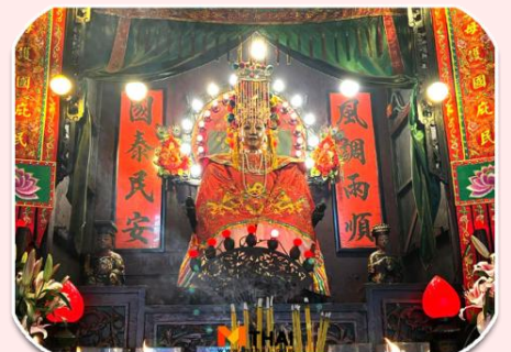
นางฟ้าพามู

จากนั้นเดินทางไปต่อที่ วัดทินหัว (วัดเจ้าแม่ทับทิม) เป็นวัดเก่าแก่ในฮ่องกง สมัยก่อนฮ่องกงเป็นหมู่บ้านชาวประมง ซึ่งคนจะให้ความเคารพนับถือเจ้าแม่ทับทิมทินหัวเป็นอย่างมาก เพราะเชื่อว่าเป็น เทพีแห่งท้อง