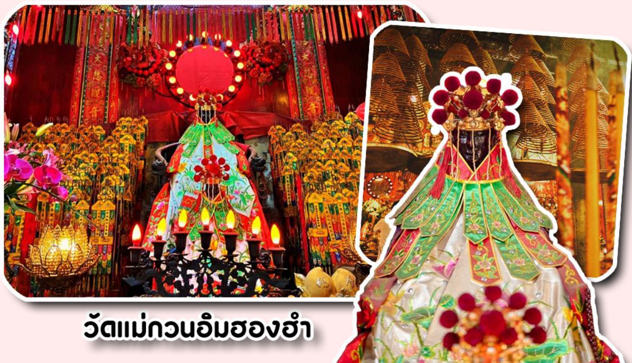
วัดแม่กวนอิมฮองฮำ

พาท่านเดินทางไปไหว้ขอพรขอเงิน วัดแม่กวนอิมฮองฮำ วัดเก่าแก่ของฮ่องกงสร้างตั้งแต่ปี ค.ศ. 1873 เป็นวัดขนาดเล็กที่มีชาวฮ่องกงศรัทธาหนักถือกันเป็นอย่างมาก วัดแห่งนี้เป็นที่ประดิษฐาน องค์เจ้าแม่กวนอิมฮองฮำ ที่มีชื่อเสียงเรื่องการให้กู้ยืมเงิน เชื่อกันว่าท่านช่วยพลิกฟื้นเศรษฐกิจของชาวฮ่องกง ผู้คนจึงนิยมมายืมเงินทำธุรกิจจนสำเร็จร่ำรวย รุ่งเรือง โดยให้ท่านอธิษฐานขอพรต่อหน้าเจ้าแม่กวนอิมฮองฮำ พร้อมกับระบุวันเวลาในการขอพรด้วย จากนั้นนำธนบัตรตามฐานะและศรัทธาที่เราจะนำเป็นสื่อในการขอพร เขียนจำนวนเงินที่ต้องการลงไปด้วย ใส่สกุลเงินยี่ดีใหญ่ แล้วนำเงินใส่ในซองแดง ควรเตรียมซองแดงไปเอง นำซองแดงไปวนรอบกระถางรูป วนขวาจำนวน 3 ครั้ง แล้วเก็บซองแดงในกระเป๋าสตางค์ เป็นเงินขวัญถุง ถ้าประสบความสำเร็จตามที่มุ่งหวังให้นำเงินในซองแดงทำบุญหยอดตู้ที่วัดแห่งนี้ในโอกาสต่อไป วิธีไหว้ให้ปัง ให้ได้โชคลาภเงินทอง ต้องไปกับเราเท่านั้น