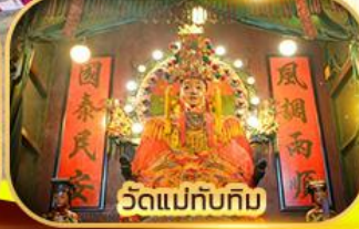
วัดแม่ทับทิม