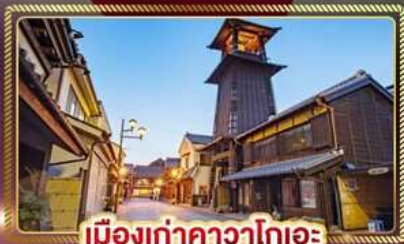
เมืองเก่าคาวาโกเอะ