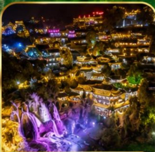
เมืองโบราณฝูหลงเจิ้น