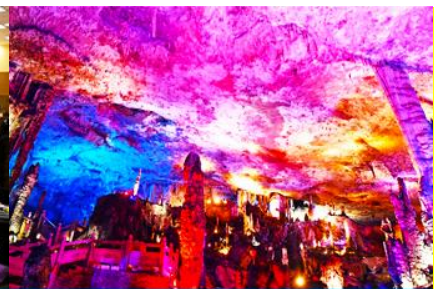
ถ้าเก้าสวรรค์วิวเทียนถั่ง