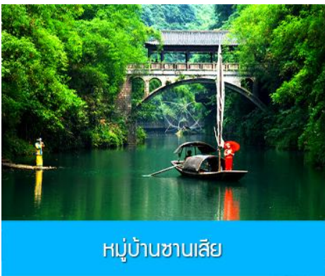
หมู่บ้านซานเสี