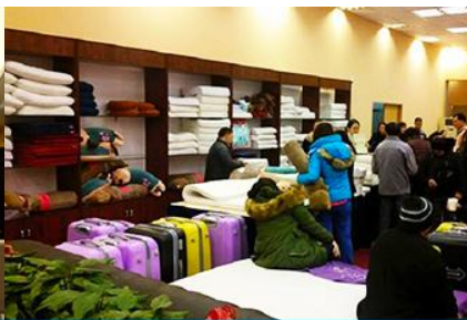
ศูนย์จำหน่ายผลิตภัณฑ์ยางพารา