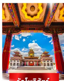
วัดโพธิ์สัตว์