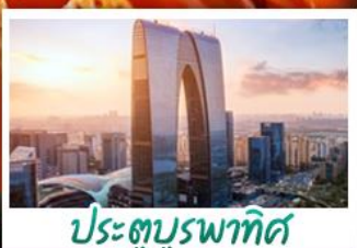
ประตูบูรพาทิศ