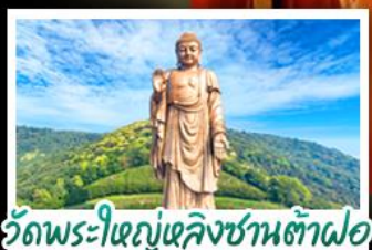
วัดพระใหญ่เฉิงชานต้าฝอ