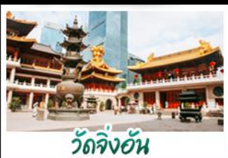
วัดจิ่งอัน