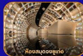
ห้างสรรพสินค้า