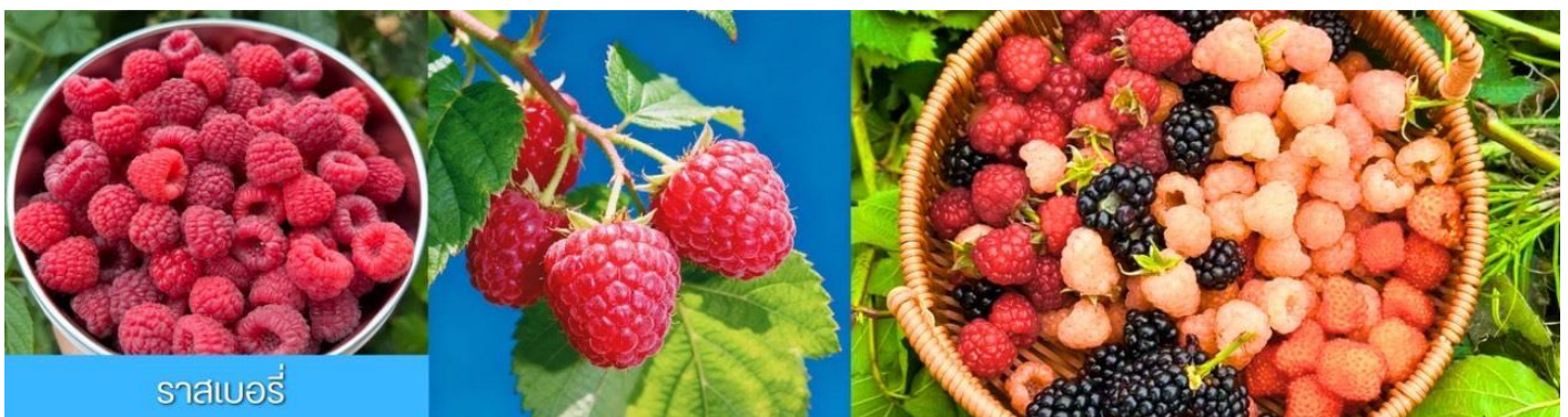
ราสเบอร์รี่