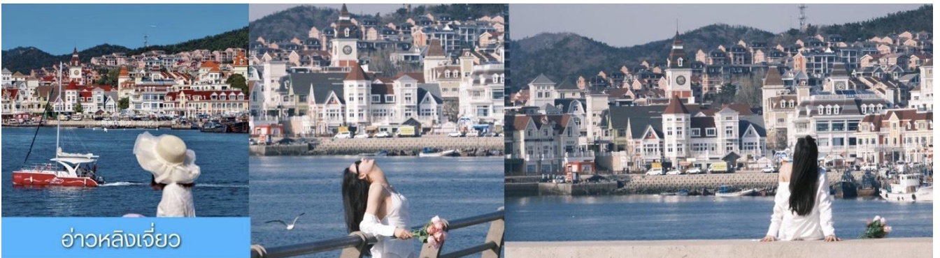
อ่าวหลิงเจี้ยว

จากนั้นนำท่านเที่ยวชม ท่าเรือประมงหู่กาน 大连渔人码头 เป็นจุดเช็คอินที่โดดเด่นด้วยสถาปัตยกรรมสไตล์ยุโรปสีสันสดใส ผสมผสานกลิ่นอายเมืองท่าดั้งเดิมเข้ากับบรรยากาศสุดโรแมนติกที่เต็มไปด้วยเรือประมง คาเฟ่ ร้านอาหาร และจุดชมวิวยุริมาทะเล