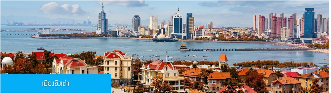
เมืองชิงเต่า