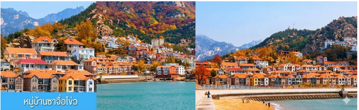
หมู่บ้านชาวโจว