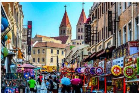
ถนนจงซาน

นำท่านเดินทางชม สะพานจ้านเจียว 栈桥 เป็นแลนด์มาร์คแห่งประวัติศาสตร์คู่เมืองชิงเต่า สร้างเมื่อปี ค.ศ.1891 มีลักษณะเป็นสะพานหินทอดยาวกว่า 440 เมตรสู่ทะเล ปลายสะพานมีศาลา ทรงแปดเหลี่ยมสีแดงที่โดดเด่น ซึ่ง เป็นสัญลักษณ์บนฉลากเบียร์ชิงเต่า ขึ้นชื่อเรื่องวิวสวย รับลมทะเล ให้ท่านเก็บภาพบรรยากาศ