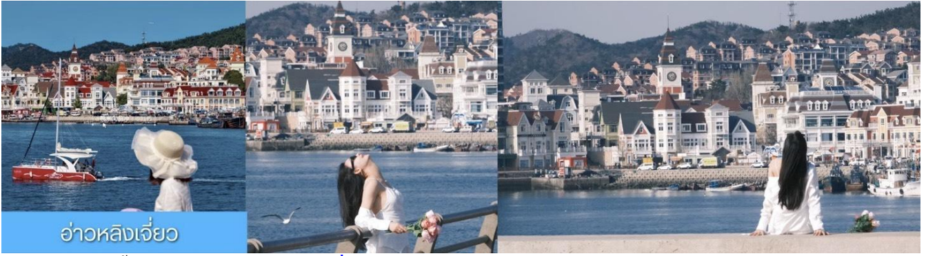
อ่าวหลิงเจี้ยว

จากนั้นนำท่านเที่ยวชม อ่าวหลิงเจี้ยว 菱角湾 เป็นอ่าวธรรมชาติและแลนด์มาร์กถ่ายรูปสุดฮิตในเมืองต้าเหลียน ประเทศจีน โดดเด่นด้วยทิวทัศน์บ้านเรือนสีแสนสดใสเรียงรายริมน้ำ จนได้รับฉายาว่า "Little Santorini แห่งต้าเหลียน" และเป็นจุดชมพระอาทิตย์ตกที่สวยงามมากแห่ง