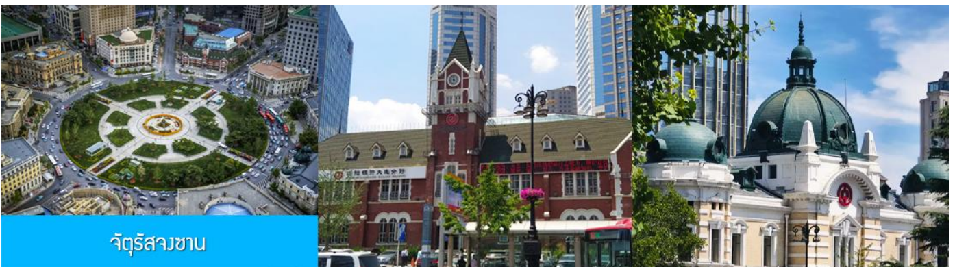
จัตุรัสวงเวียน

จากนั้นนำท่านเที่ยวชม อ่าวหลิงเจี้ยว 菱角湾 เป็นอ่าวธรรมชาติและแลนด์มาร์กถ่ายรูปสุดฮิตในเมืองต้าเหลียน ประเทศจีน โดดเด่นด้วยทิวทัศน์บ้านเรือนสีแสนสดใสเรียงรายริมน้ำ จนได้รับฉายาว่า "Little Santorini แห่งต้าเหลียน" และเป็นจุดชมพระอาทิตย์ตกที่สวยงามมากแห่ง