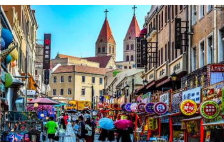
ถนนวงเวียน