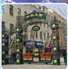
ถนนจงยาง