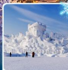
งานแกะสลัก เกาะพระอาทิตย์