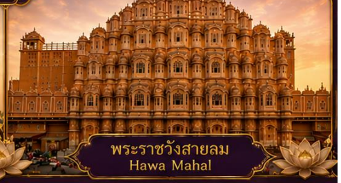
พระราชวังสายลม Hawa Mahal