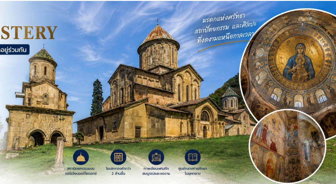
มรดกแห่งศรัทธา สถาปัตยกรรม และศิลปะ ที่งดงามเหนือกาลเวลา