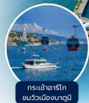
กระเช้าอาร์โก ชมวิวเมืองบาตุมิ