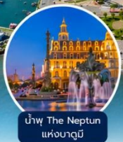
น้ำพุ The Neptun แห่งบาตุมิ