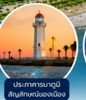
ประภาคารบาตุมิ สัญลักษณ์ของเมือง