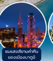
ชมแสงสียามค่ำคืนของเมืองบาตุมิ