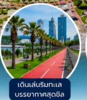
เดินเล่นริมทะเล บรรยากาศสุดชิล