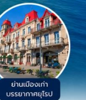
ย่านเมืองเก่า บรรยากาศยุโรป

☁️ การล่องเรือขึ้นเข้านั่งอยู่กับสภาพอากาศ กรณีที่ไม่สามารถล่องเรือได้ ทางบริษัทของสงวนสิทธิ์ปรับเปลี่ยนโปรแกรมตามความเหมาะสม