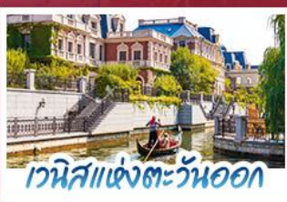
เวนิสแห่งตะวันออก