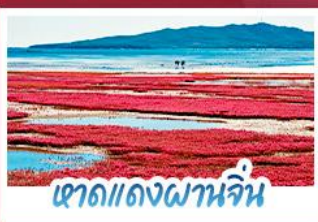
หาดแดงผานจีน