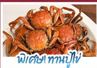
พิเศษ! ทานปูใหญ่

ปรากฏการณ์ธรรมชาติ 1 ปี มีแค่ครั้งเดียว! เตรียมชุดเก่งไปถ่ายรูปกับ 'หาดแดงผานจีน' ที่กำลังพร้อมสีแสดสดไปทั่วผืนน้ำ พร้อมฟินสุดขีดกับฤดูกาลทานปูที่คึกคักที่สุดแห่งปี • สัมผัสสวนสิมแห่งตะวันออกที่ต้าเหลียน