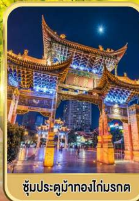
ซุ้มประตูม้าทองไถ่มรดก