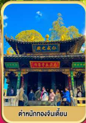
ตำหนักทองจินเตียน