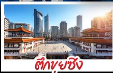
ตึกยูยซิง